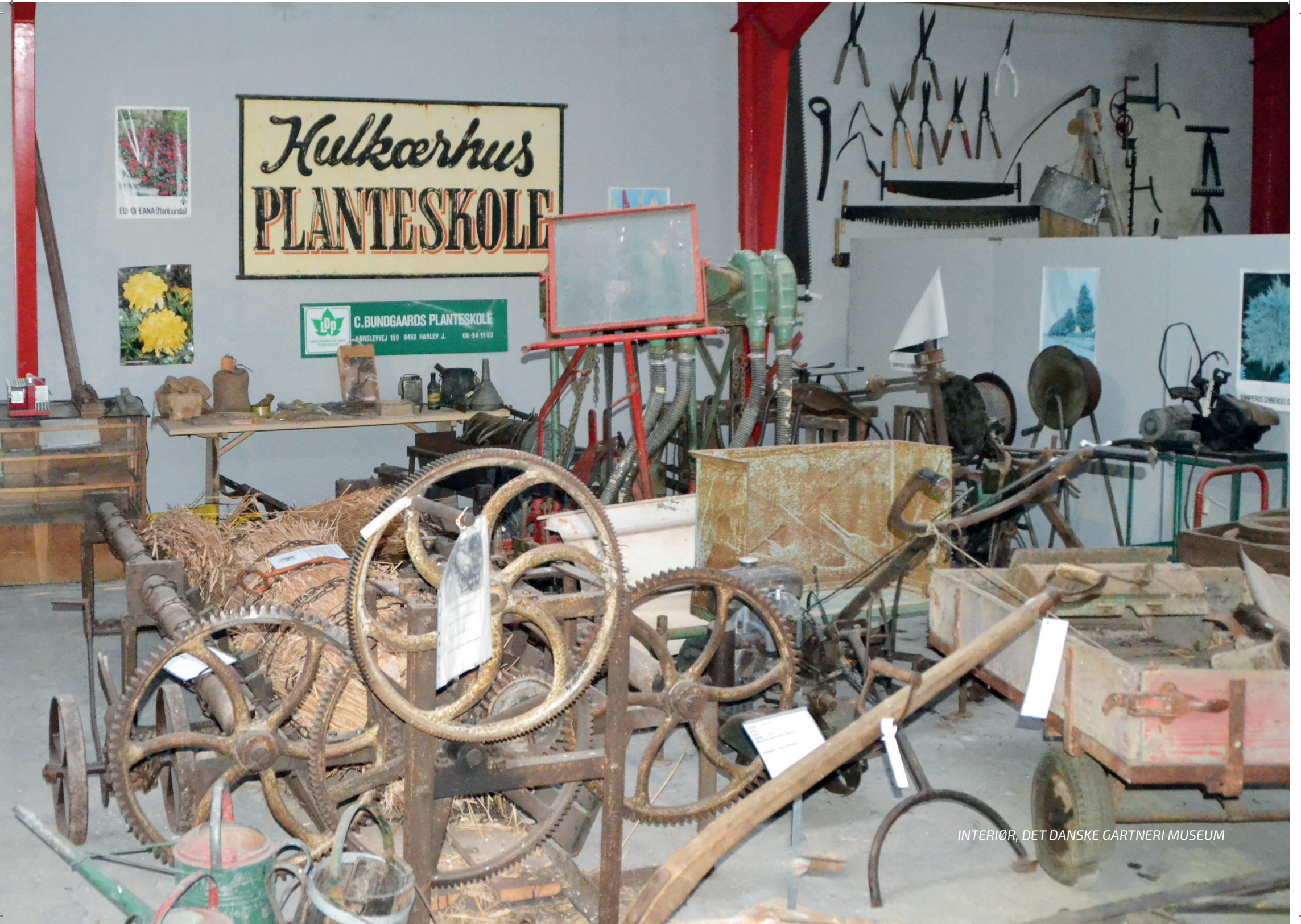
INTERIØR, DET DANSKE GARTNERI MUSEUM