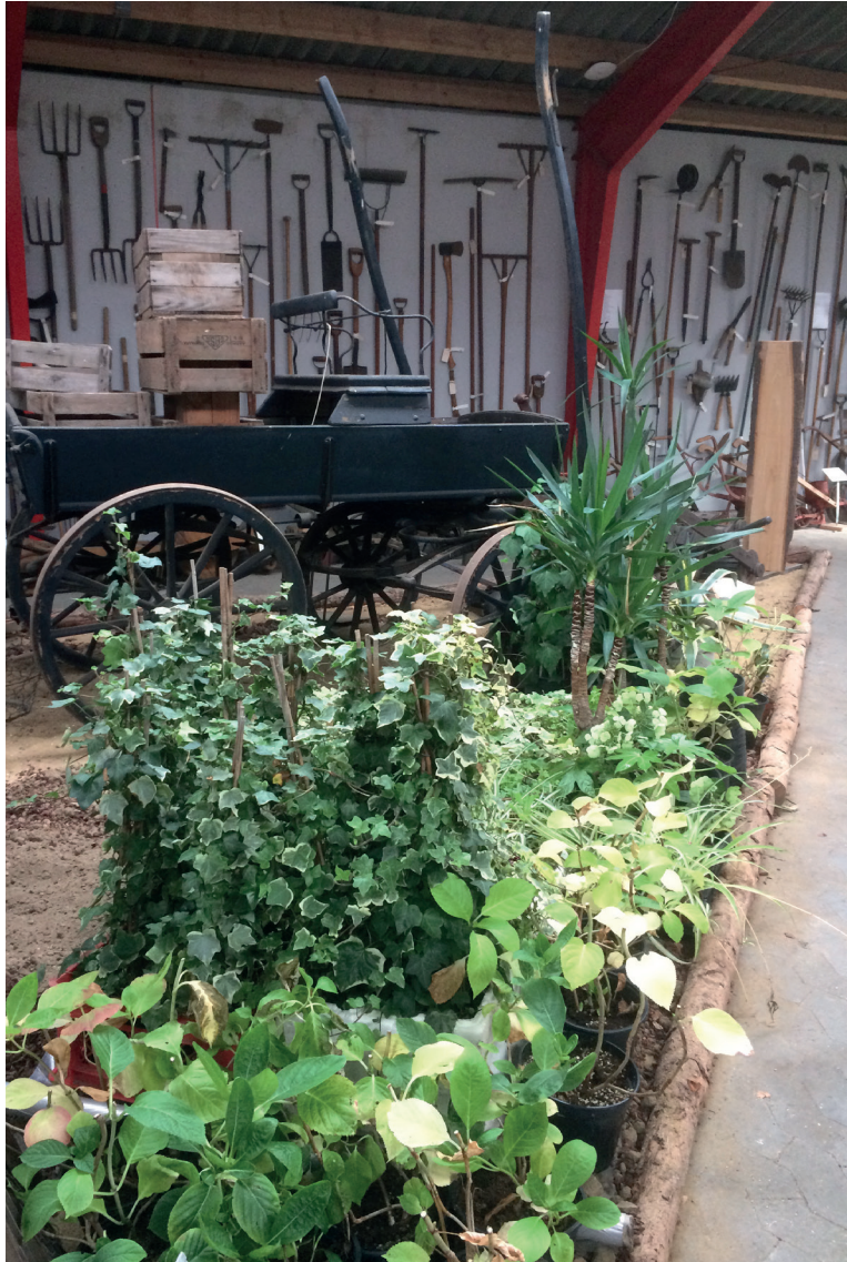
DET DANSKE GARTNERIMUSEUM