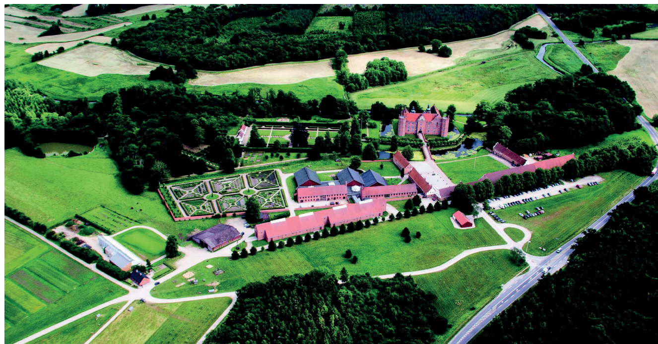
BILLEDE AF DET GRØNNE MUSEUM

faktastærkt og troværdigt museum, hvor menneskets møde med og brug af naturen formidles både i udstillinger og det fortættede og differentierede kulturlandskab lige udenfor museets døre.