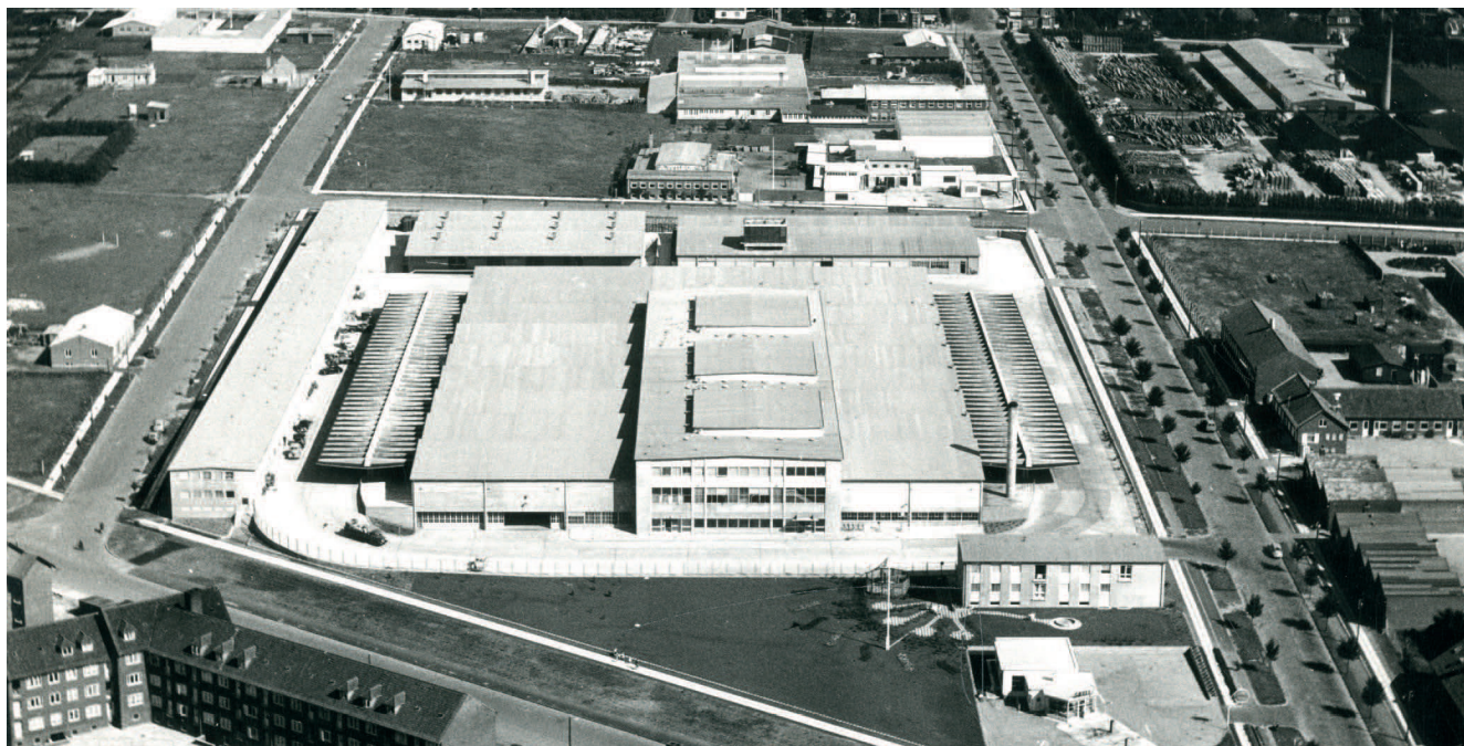
GASA I ÅRHUS, 1955

Gartnerierne oplevede allerede i 1800-tallet en rivende udvikling og specialisering. En ny branche udviklede sig og som en konsekvens heraf, skabtes et behov for organisering. Gartneriejerne organiserede sig derfor i 1887 i Alm. Dansk Gartnerforening - i dag kendt som Dansk Gartneri hjemmehørende på Axelborg i København side om side med Dansk Landbrug. Axelborg er i dag hovedsædet for Landbrug & Fødevarer.