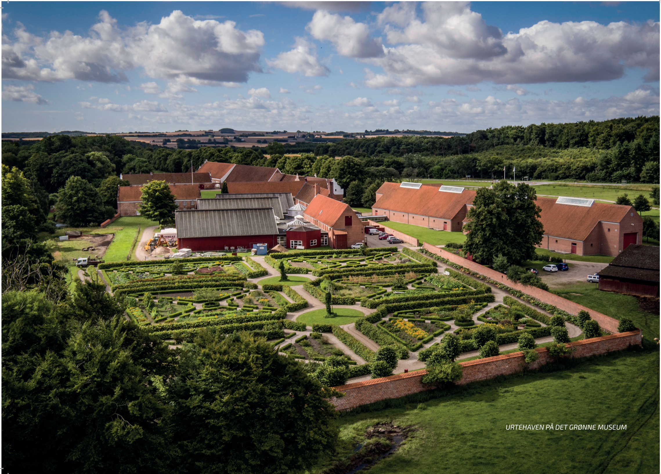
URTEHAVEN PÅ DET GRØNNE MUSEUM