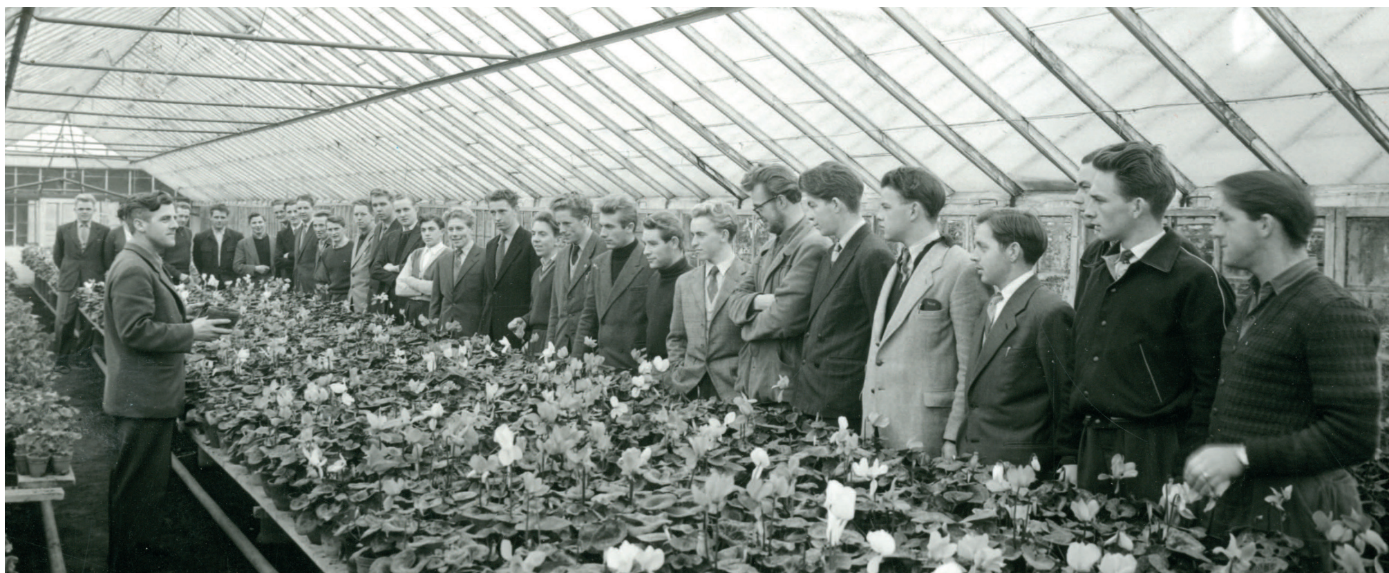
UNDERVISNING PÅ BEDER GARTNERSKOLE OMKRING ÅR 1954-55

En væsentlig faktor i dansk gartneris udvikling og succes gennem tiden er gartneruddannelserne. Disse startede i det små med etablering af den første gartnerskole, Vilvorde på Sjælland, i 1875. Siden blev uddannelserne en del af højskole-