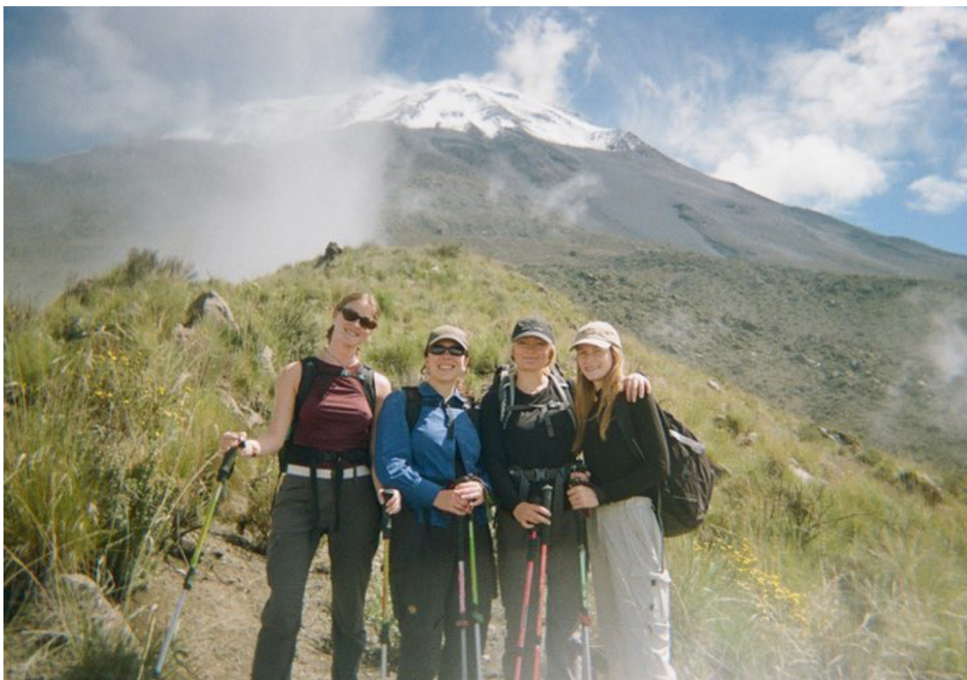
På vulkanen Misty