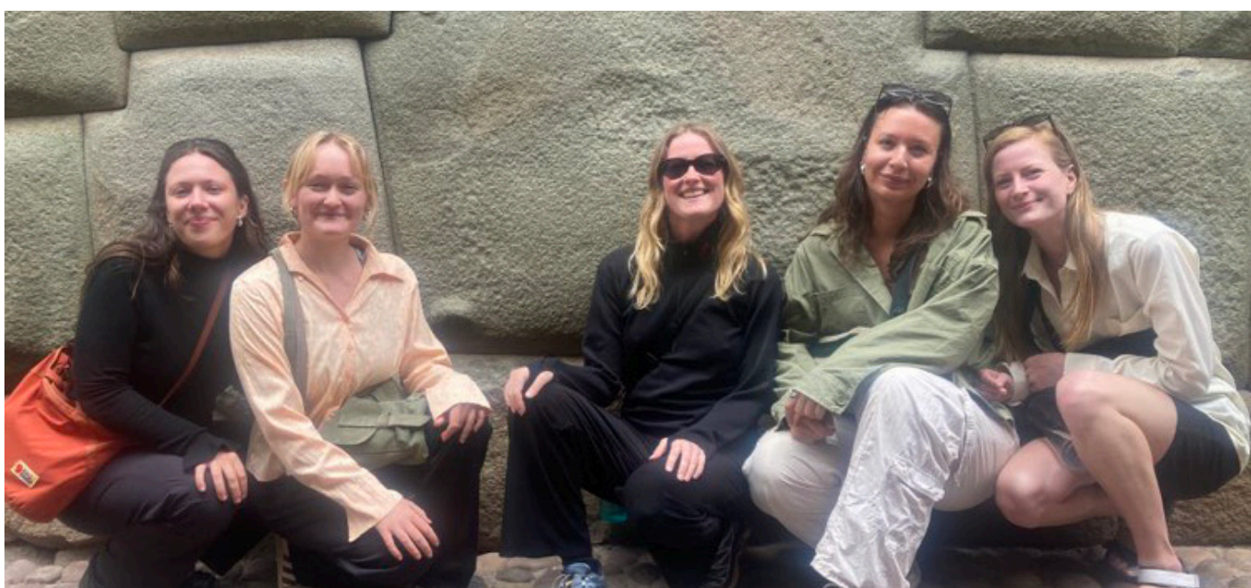
Os alle fem foran den berømte 12 kantede sten i Cusco

Efter vores feltstudier fortsatte vi til Cusco, hvor vi udforskede byens rige kultur, blandt andet gennem de farverige markeder. Dernæst rejste vi til Arequipa, hvor vi markerede to fødselsdage ved at bestige den imponerende vulkan Misti, som har en gletsjer på toppen, og ned ad bjerget mountainbikede vi i regnvejr.