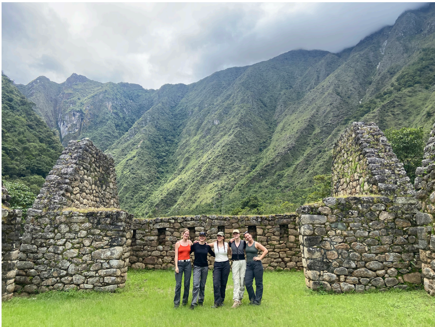
Gruppe foto af os alle fem på inka trail