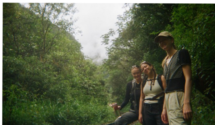
Feltarbejde på Inks trail